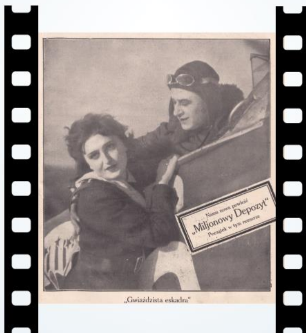
KADR Z FILMU "GWIAZDZISTA ESKADRA" ZAMIESZCZONY NA OKŁADCE "WIELKOPOLSKIEJ ILUSTRACJI", NR 15 ZE STYCZNIA 1930 R.