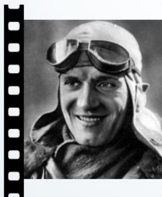
JANUSZ MEISSNER - AUTOR POPULARNYCH POWIEŚCI LOTNICZYCH.