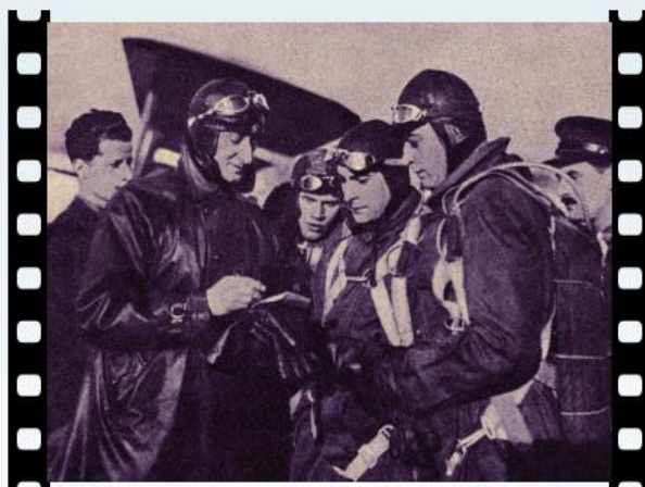
ZDJĘCIE POWIETRZNE WYMAGAŁY ŚCISŁEJ KOORDYNACJI, PRZYPOMINAJĄC NIERAZ PLANOWANIE PRAWDZIWYCH DZIAŁAŃ WOJENNYCH ESKADRY MYŚLIWSKIEJ.