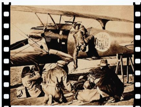
ZDJĘCIE Z PLANU FILMOWEGO. EKIPA FILMOWA PODCZAS KRĘCENIA JEDNEJ ZE SCEN.

ZDJĘCIA PLENEROWE ZREALIZOWANO NA LOTNISKU ŁAWICA ORAZ NA POLIGONIE W BIEDRUSKU. ZBUDOWANO TAM LOTNISKO POŁOWE ODTWARZAJĄCE WARUNKI WOJENNE. ZDJĘCIA ATELIEROWE WYKONANO W HALI PRZEMYSŁU CIĘŻKIEGO NA TERENACH TARGÓW POZNAŃSKICH. FILM ZASŁYNAŁ BRAWUROWYMI SEKWENCJAMI LOTNICZYMI. ZDJĘCIA Z POWIETRZA WYKONYWANE BYŁY PRZY POMOCY KAMER, DOSTOSOWANYCH DO ZDJĘĆ LOTNICZYCH. WIELE ZDJĘĆ WALK POWIETRZNYCH WYKONAŁ OPERATOR ANTONI WAWRZYNIAK Z POKŁADU SAMOŁOTU.