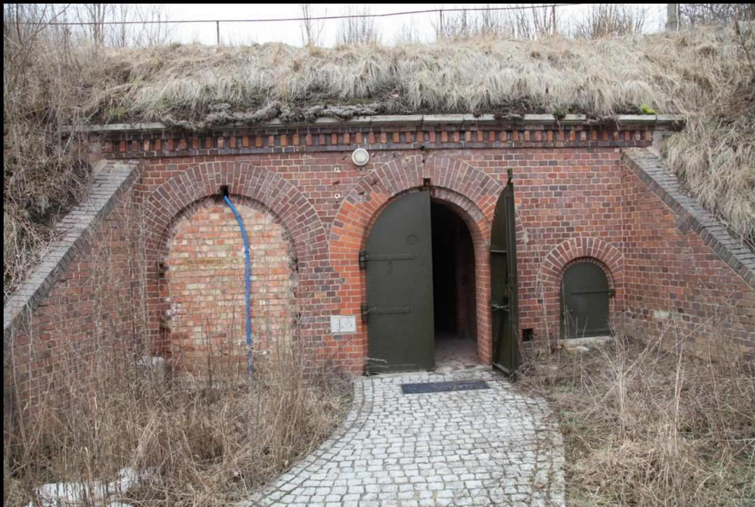
Wejście do prawej prochowni Fortu VII