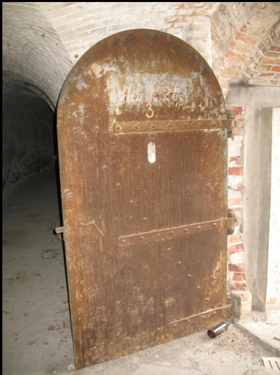
Etap 19. Czołowa strzelecka galeria przeciwsłoneczna

Zachowane drzwi (z oryginalnym napisem) zamykające wejście, przez które zwiedzający będą wchodzić z fosy do galerii przeciwsłonecznej;