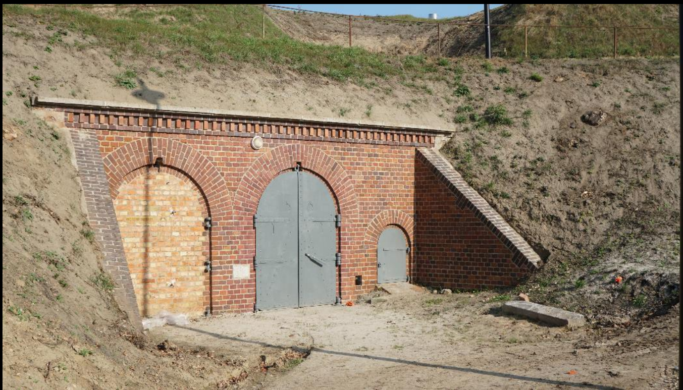
Wejście do prawej prochowni Fortu VII – w trakcie remontu