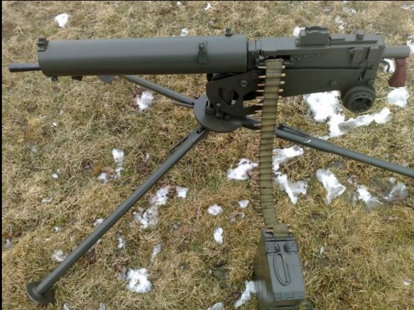
Replika karabinu maszynowego Browning wz. 30, jaka będzie ustawiona w polskim schronie obserwacyjno- bojowym